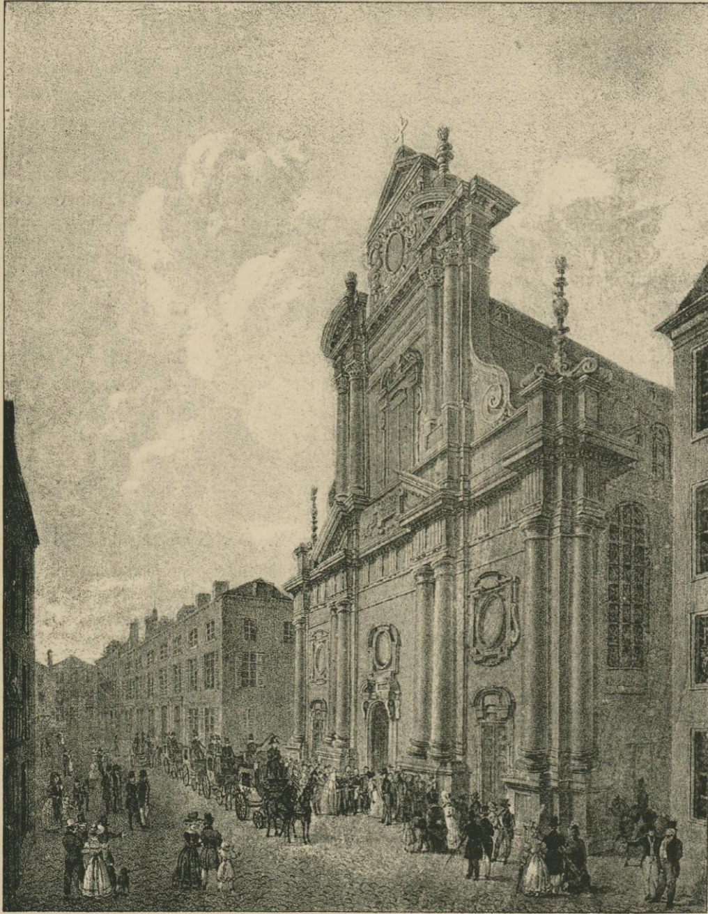
LE TEMPLE DES AUGUSTINS.

Le roi Guillaume sortant du service divin. — Fac-simile de la lithographie de Boëns et Madou.